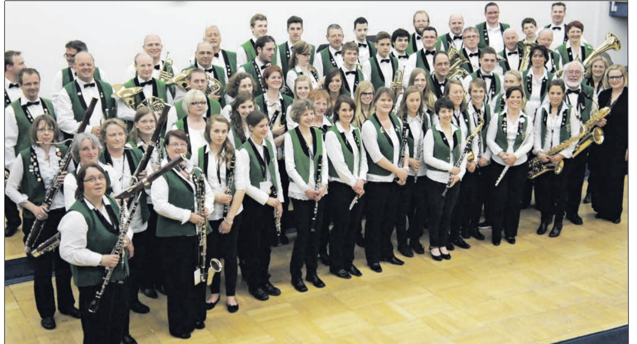
Erfolgreich: das große Bläserorchester beim Deutschen Musikfest 2013 in Chemnitz