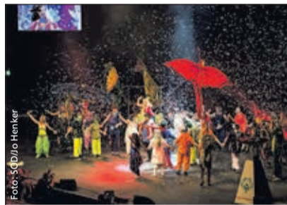
Die bunte Truppe aus Marsberg verzaubert das Publikum.