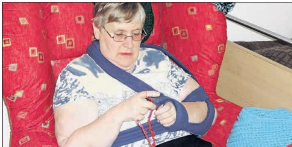
Elisabeth bei ihrer Lieblingsbeschäftigung

Selbst mit einer gebrochenen Schulter häkelte sie weiter – dann eben etwas langsamer.