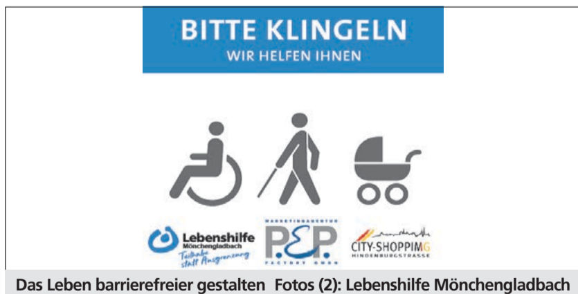
Das Leben barrierefreier gestalten

41238 Mönchengladbach Telefon: (0 21 66) 3 99 77 11 verwaltung@lebenshilfe-mg.de