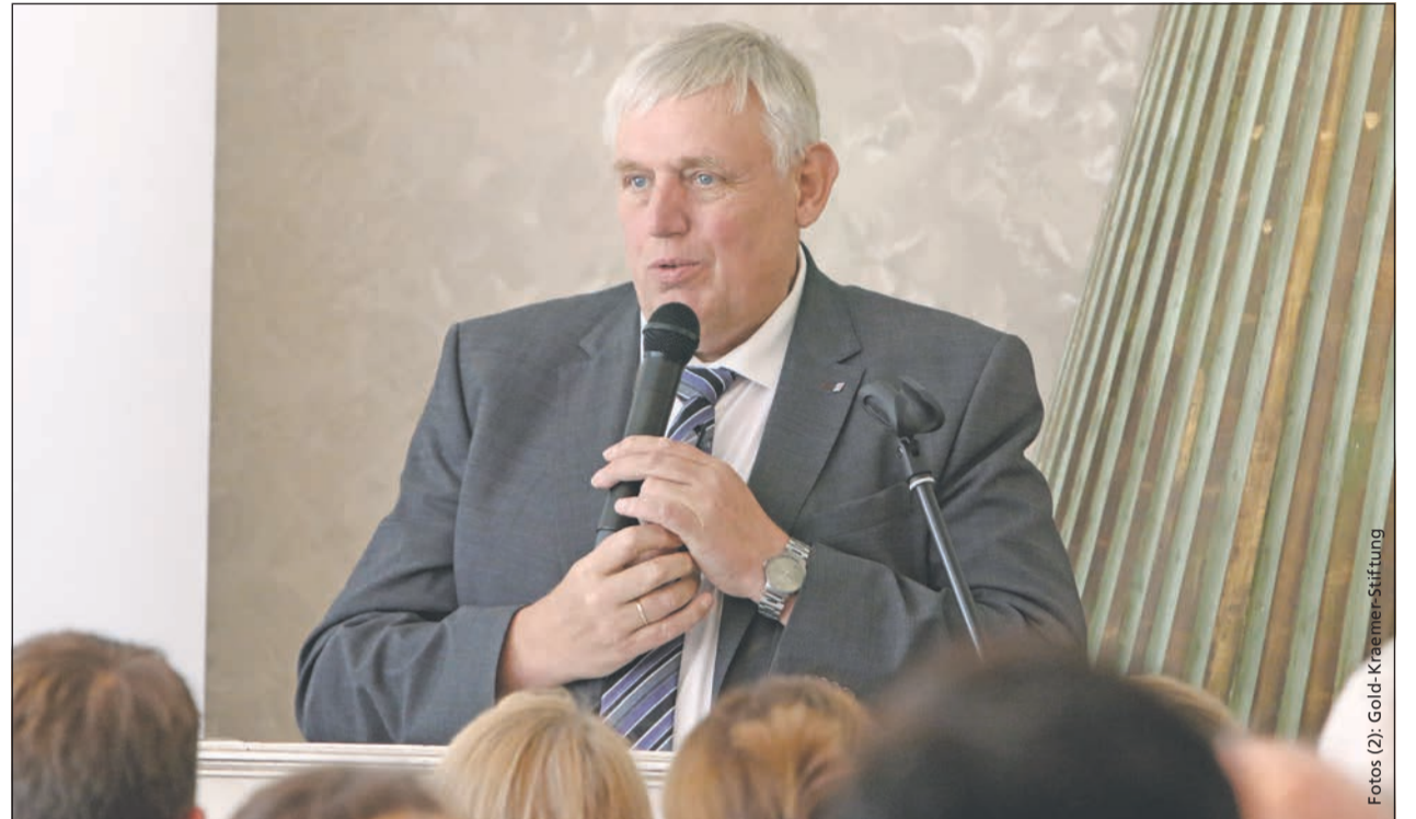
NRW-Gesundheits- und Sozialminister Karl-Josef Laumann sprach beim 10-jährigen Festakt des FIBS

NRW-Gesundheits- und Sozialminister Karl-Josef Laumann beim Festakt zum 10-jährigen Bestehen des Forschungsinstituts für Inklusion durch Bewegung und Sport (FIBS) in Frechen