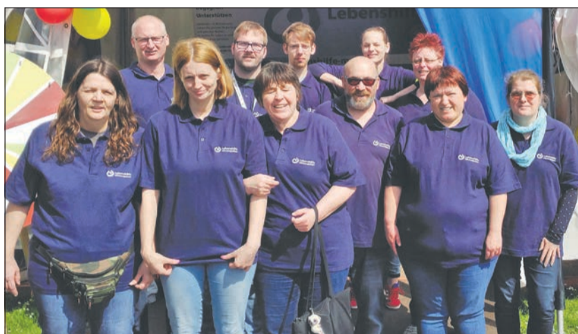
Mit Engagement und Spaß bei der Sache

Die Lebenshilfe Mönchengladbach mittendrin