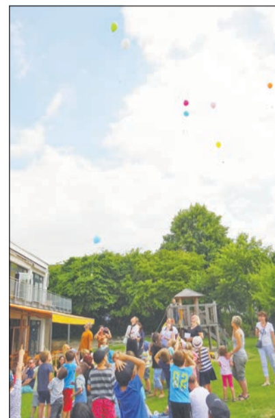
Luftballon-Aktion in der Kita

Was kaufen wir zum Mittagessen ein? Welche Bücher lesen wir in der Runde? Welches Sandspielzeug soll angeschafft werden? Kinder bestimmen und gestalten mit in der inklusiven Kita „Hürther Ströpp“ der Lebenshilfe Rhein-Erft-Kreis e.V. So wurde beispielsweise nur das Sandspielzeug angeschafft, das die Kinder wollten.