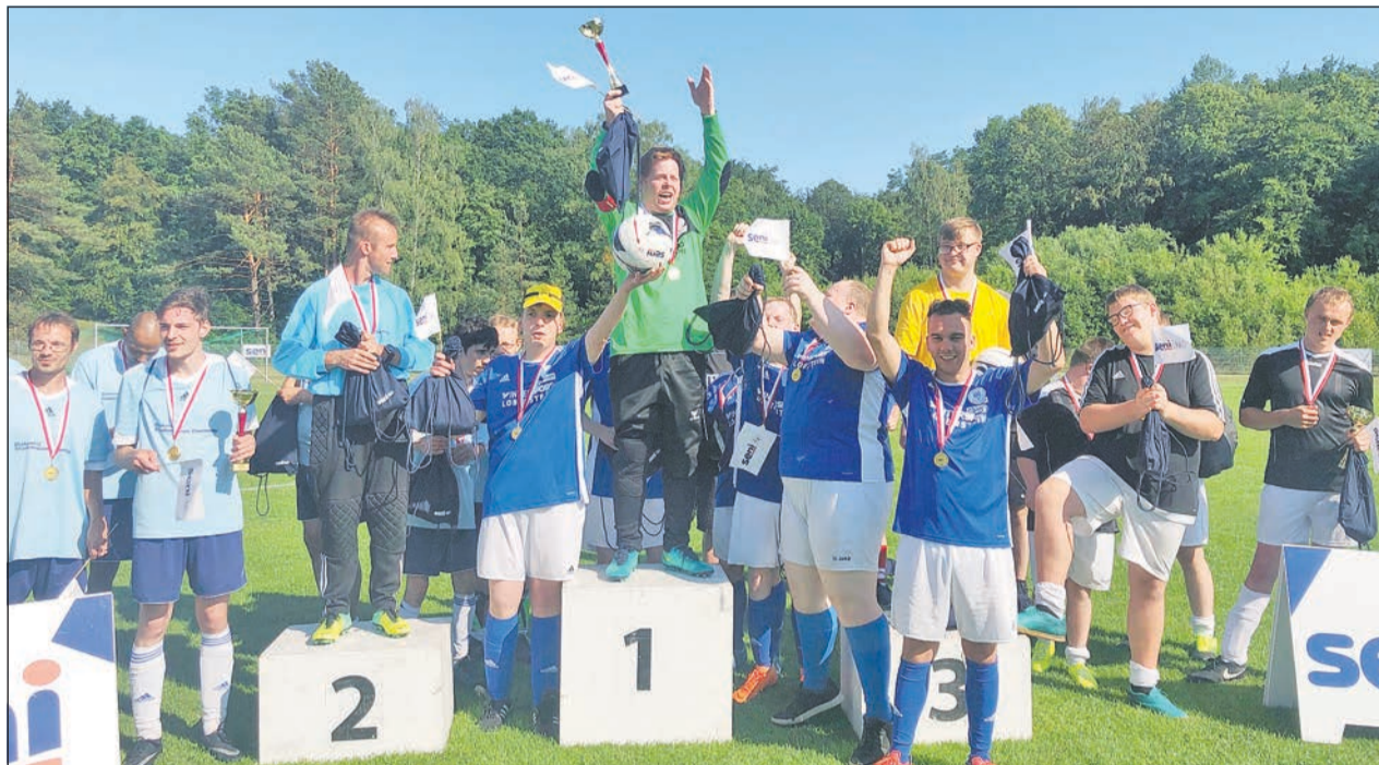
Jubeln über den Sieg in Gruppe 2 beim Seni-Cup: die „Mannschaft Inklusive“.

Von einem besonderen Fußballprojekt zu einer starken Mannschaft