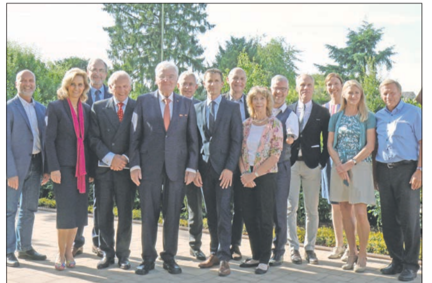
Dabei waren namenhafte Persönlichkeiten aus Wissenschaft, Wohlfahrt, der Gold-Kraemer-Stiftung, Politik und Verwaltung.

be am Arbeitsleben, Verbesserung der Mobilität oder Bewegung und Sport von Rollstuhlnutzern. Ein zentrales Anliegen sei es nun, so das Institut, in Zukunft den Sport über die einzelnen Fachinstitutionen hinaus neu zu organisieren. Vereine, Schulen, Einrichtungen der Eingliederungs- und Altenhilfe, der Arbeitsplatz sowie nachbarschaft-