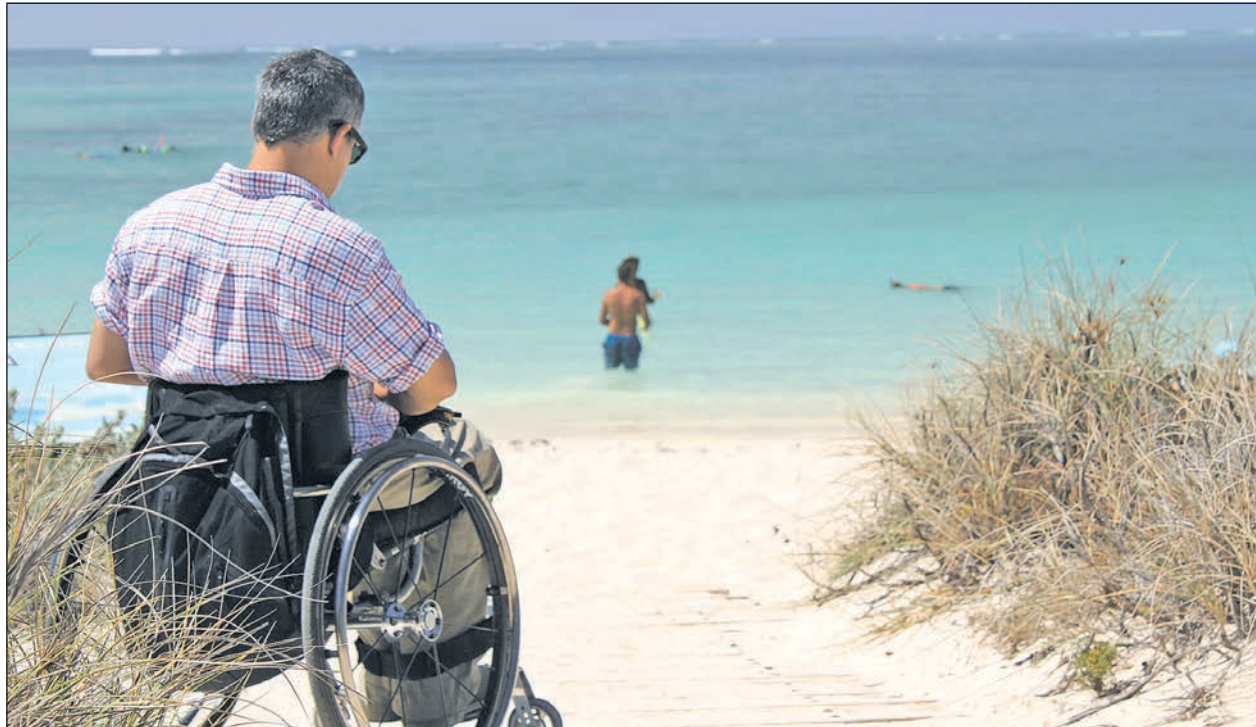
Mit uns auf TourZeit.