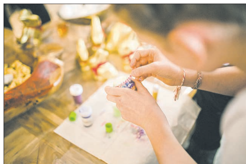
Spaß satt beim Basteln.

Osterhasen und Osterkörbchen gebastelt oder es wurden lustige Spiele wie zum Beispiel „Eierlauf“, gespielt. Das Auspusten und Färben von Ostereiern, das Backen und Vernaschen von süßen Osterhasen und eine spannende Osterhasenrallye durften natürlich auch nicht fehlen. Mit viel Spiel und Spaß haben rund zehn Kinder die erste Osterferienwoche in der Lebenshilfe Mönchengladbach verbracht.