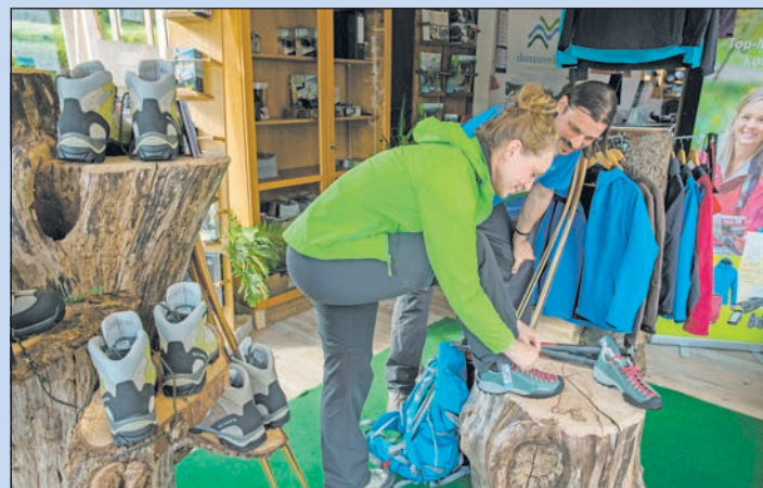
Vaude-Rucksäcke und weiteres hochwertiges Wanderequipment kann in den Best of Wandern-Testcentern im Dachstein Salzkammergut (o.), Donauebergland (li.) und im Naturpark Ammergauer Alpen kostenfrei für einen Tag ausgeliehen werden (alle Testcenter siehe Karte).