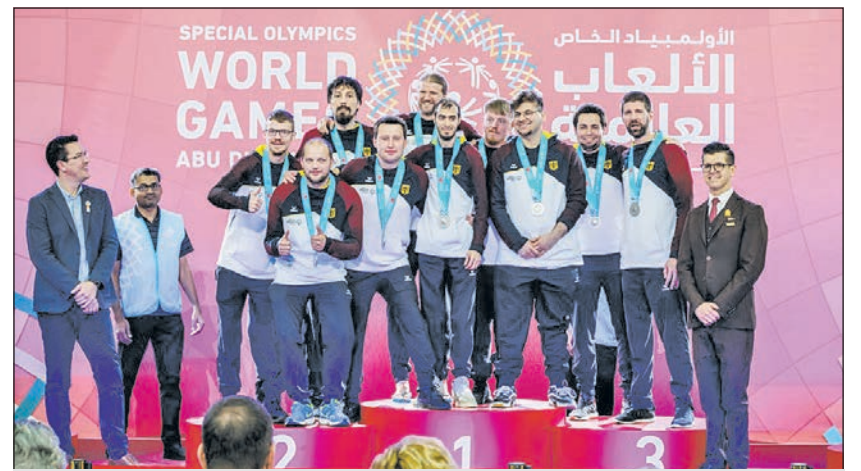
Freute sich über Silber: das Team der Unified-Basketballer aus Hagen.

Bei Special Olympics starten die Athleten in ihren Leistungsgruppen und erhalten dadurch alle die Chance auf gute Platzierungen und damit auf Anerkennung. Für die vielen großartigen Momente an Spannung und Emotionen steht u.a. das Spiel des Handball Unified Teams um Platz 3 gegen