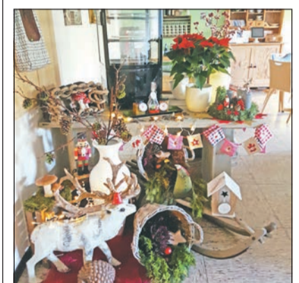
Martinsmarkt im Café LebensRaum.

E rstmals veranstaltete die Lebenshilfe Mönchengladbach einen Martinsmarkt. Die Räume vom Café LebensRaum luden bei festlicher Stimmung ein, zu verweilen.