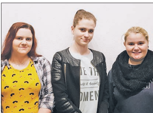
Gemeinsam sind wir stark.

S eit dem 1. Juni 2018 liegt die „durch die Lebenshilfe MG betreute Wohngemeinschaft für Frauen im wunderschönen Stadtteil Rheindahlen – optimal angebunden an den Ortskern und der damit vorhandenen guten Infrastruktur. In dem liebevoll renovierten Haus leben drei Frauen, entweder jeweils in einem Zimmer oder in zwei eigenen Zimmern, aber immer mit zusätzlich viel Platz für gemeinschaftliche Aktivitäten in und außerhalb des Hauses und im großen Garten.