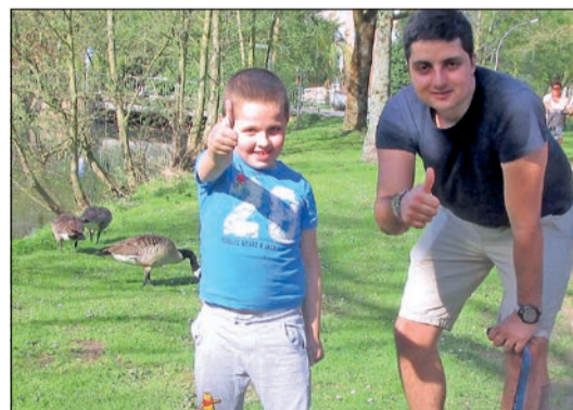
Ein tolles Tandem

Wenn Sie selber als Betreuer oder Betreuerin aktiv werden möchten oder bei Interesse an einer Einzelbetreuung für Ihr Kind, melden Sie sich gerne bei uns. (Swantje Anna Kretschmann (0 21 66) 3 99 77 22 oder per E-Mail s.kretschmann@lebenshilfe-mg.de)