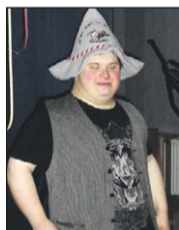
Booster im Festzelt

Bühne gestanden und richtig abgerockt, auch die anderen von uns haben mitgemacht, ja, das stimmt, ... bis zum Schluss, schwärmt Thommy.