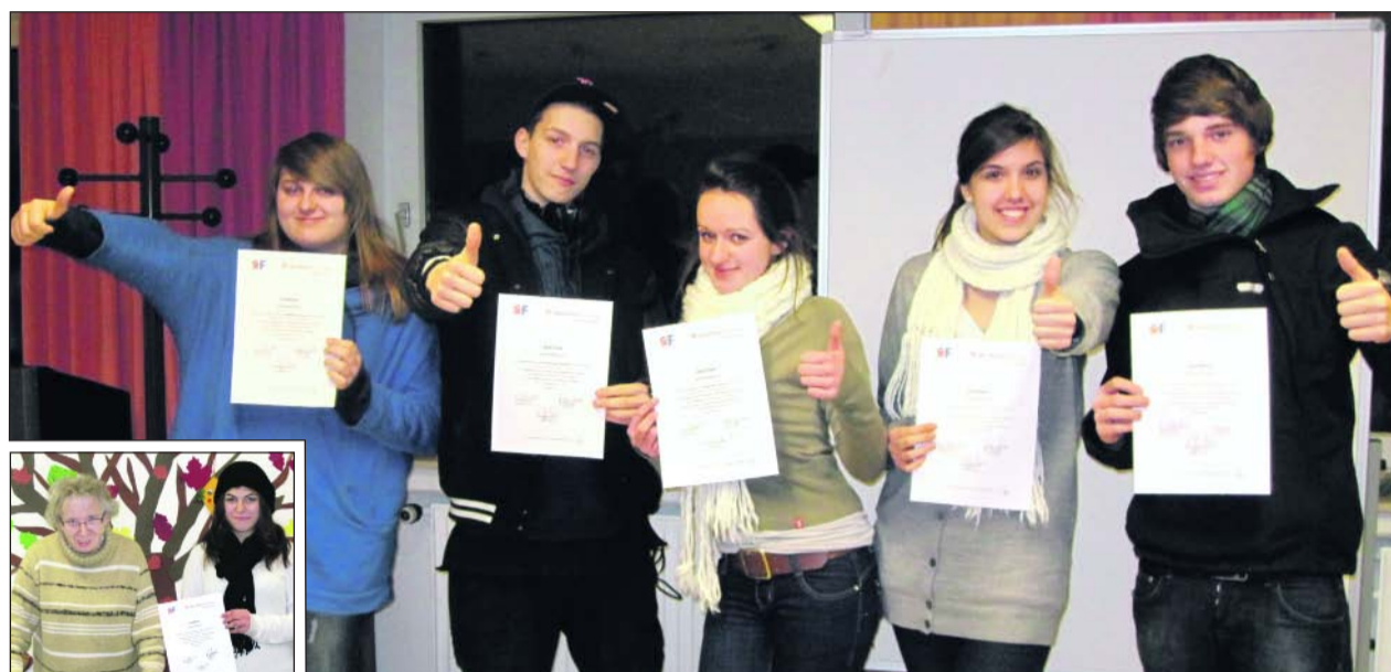
Begegnung der anderen Art beim Projekt „Sozialführerschein“.

Im Rahmen eines angeleiteten Praktikums in den Wohnhäusern der Westfalenfleiß GmbH begegnen Jugendliche Menschen mit Behinderungen auf gleicher Augenhöhe. So können sie Berührungsängste und Vorurteile abbauen und erste berufsorientierende Eindrücke sammeln. Das Projekt „Sozialführerschein“ richtet sich an Schüler der 9. und 10. Klasse von Hauptschulen, Realschulen und Gymnasien für Jugendliche zwischen 14 und 17 Jahren. Im Rahmen des Projektes besuchen Schüler ein Wohnhaus in ihrem Stadtteil. So wird eine persönliche Beziehung zu Menschen mit Behinderung aufgebaut: „Somit kann auch ein weiteres Ziel des Projekts,