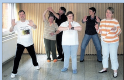
Manchmal gibt es kleine Hilfestellungen.

zu finden“, sagt van Thriel. Auf dem Programm standen Ausflüge wie der zum Deltapark Neeltje Jan, wo die Kunststücke von Robben und Seelöwen bewundert wurden, sowie natürlich eine Bootsfahrt. Schön war es auch, einfach mitten im Trubel auf dem Markt im Café zu sitzen und „Käffchen zu trinken“ oder den Tag gemütlich auf dem Balkon ausklingen zu lassen. S. v. Thriel rückblickend: „Renesse war für uns eine kleine Wohlfühl- und Entspannungs- und Ausruhen. Für unsere Bewohner ein Ausgleich zum Alltag am Arbeitsplatz und in der Wohnstätte.“