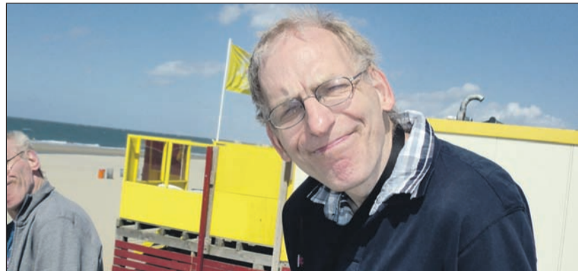
Entspannte Stimmung am Meer.

Urlaub in Renesse erfüllte alle Erwartungen