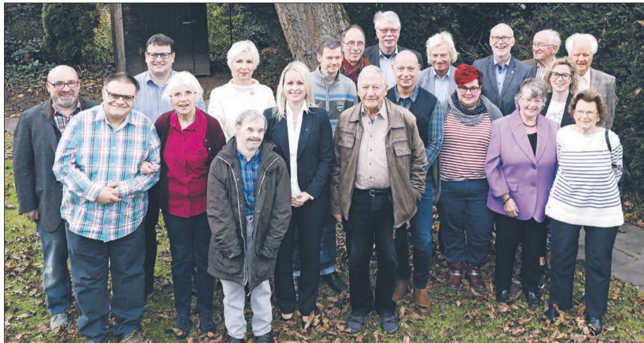
Gemeinsam erreichen wir mehr!

Konkret dagegen ist, dass der Bereich FreizeitSpaß unterstützt wird. Durch eine Spende kann ein Spiel- und Klettergerüst angeschafft wer-