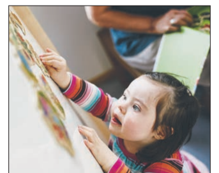
Förderung der Kleinsten