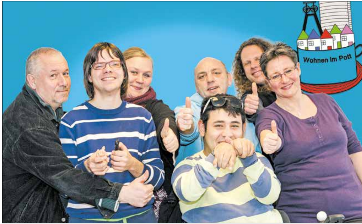
Das Team von „Wohnen im Pott“ kümmert sich unter anderem um die Wohnungsvermittlung von Menschen mit Behinderung in Oberhausen.

Projekt der Lebenshilfe Oberhausen berät Menschen mit Behinderung bei der Wohnungssuche / Auszeichnung mit Inklusionspreis NRW