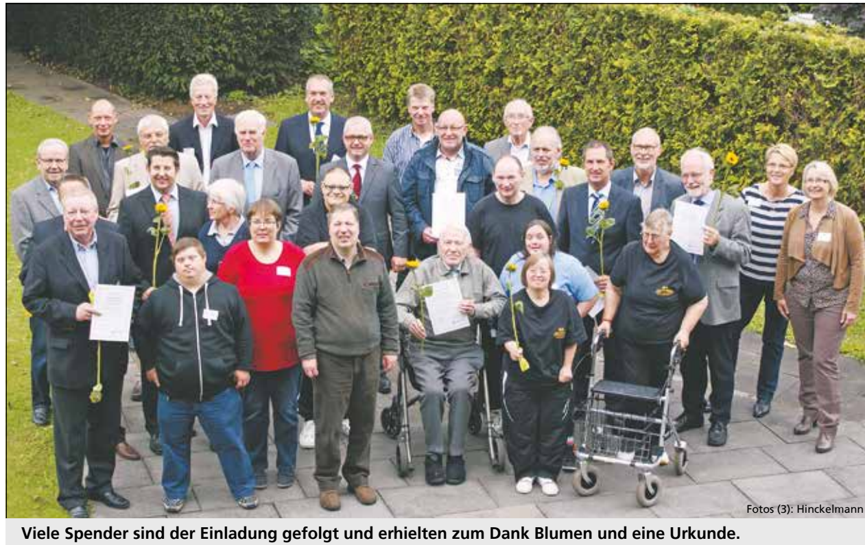
Viele Spender sind der Einladung gefolgt und erhielten zum Dank Blumen und eine Urkunde.

Es gibt ein Café, viele kreative Kurse für Erwachsene und Kinder, ein kleines Reisebüro, welches Ausflüge und Reisen für Menschen mit Behinderungen anbietet, Kochkurse, Ferienbetreuungen