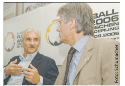
Mit WM-Botschafter Rudi Völler vor dem WM-Finale.

Von Ruhestand hielt der umtriebige Visionär nichts. Bis zuletzt war der 71-Jährige leidenschaftlich für die Lebenshilfe tätig – als Berater der Lebenshilfe Bocholt und Geschäftsführer der Lebenshilfe Inklusive Dienste und stellvertretender