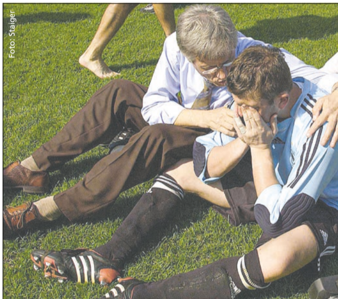
Großes Herz für Menschen mit Behinderung, hier nach der WM-Halbfinal-Niederlage gegen die Niederlande.

NRW, die Organisation der Selbstbestimmungsrechte der Menschen mit Behinderung, die mittlerweile im Bundesteilhabegesetz verankert sind. Der Höhepunkt seiner Arbeit, abseits des Engagements für die Teilhabe und Weiterentwicklung von Wohnangeboten in NRW, war die Organisation der gesellschaftlichen Kampagne zur Fußball WM der Menschen mit geistiger Behinderung 2006, mit der erstmals eine breite öffentliche Aufmerksamkeit in der deutschen Gesellschaft erreicht werden konnte. 2009 wurde auf Wagners Initiative das bundesweit erste Fußballleistungszentrum für Menschen mit geistiger Behinderung in Frechen bei Köln eröffnet.