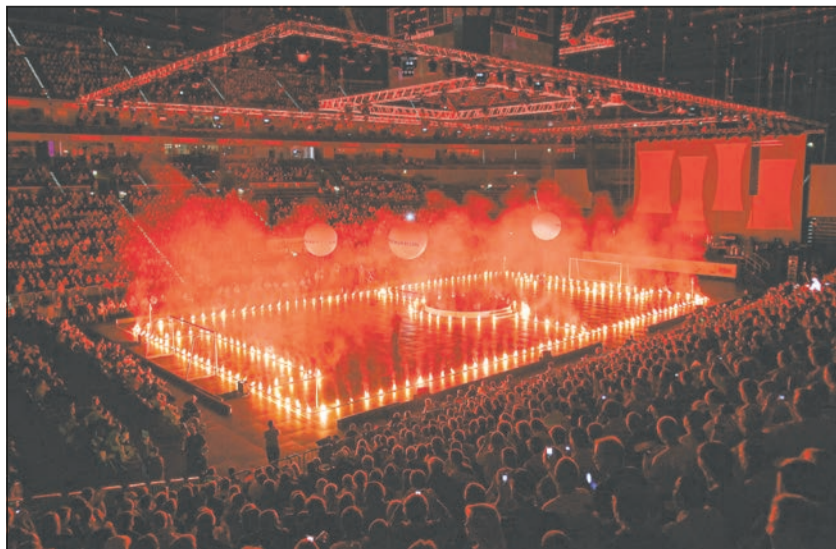
Beeindruckende Eröffnungsfeier der Fußball WM der Menschen mit Behinderung 2006 in der Kölnarena.