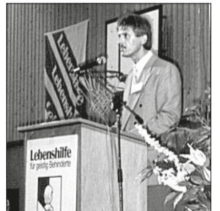
Engagiert als junger Geschäftsführer 1992.