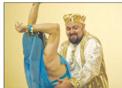
„Lecker‘ Schnittchen“ – emotionales Tanzvergnügen

von Udo van Deursen von den „Leckere Jecke“ mit einem dreifachen „Halt Pohl“ und einem dreifachen „All Rheydt“ verabschiedet. Und alle im Saal machten mit.