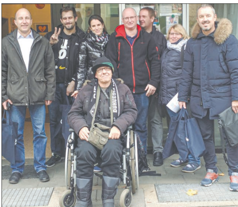
Im Team unterwegs bei Wind und Wetter: Mitarbeiter von AFL und der Lebenshilfe Mönchengladbach.

2019 setzten Lebenshilfe Mönchengladbach und AFL zwei gemeinsame Aktionen um. So konnte sich die Bewohnerschaft des Wohnhauses in Neuwerk über einen Anstrich für Holzterrasse und Holzhaus freuen. Ein zweites Team von AFL war mit Mitarbeitern und BeWo-