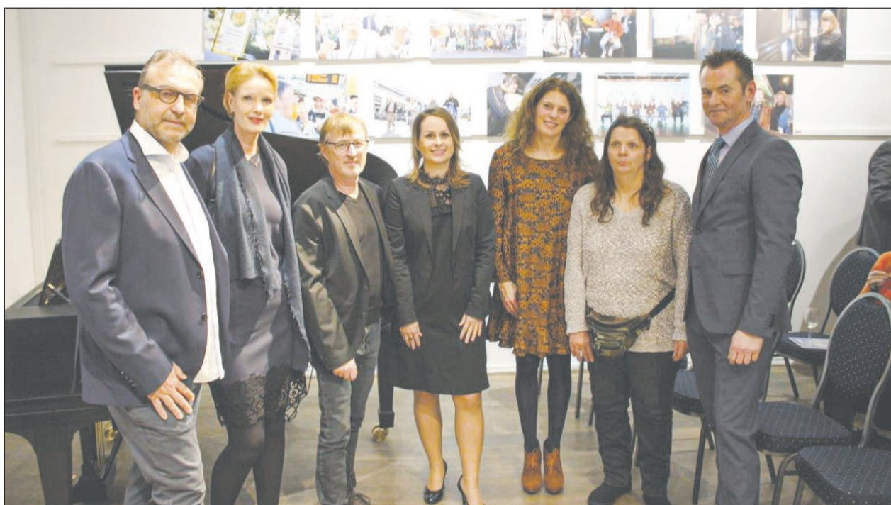
Ein Projekt, das verbindet