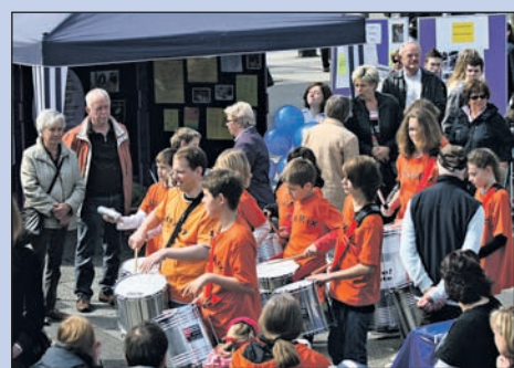
Buntes Treiben beim Aktionstag 2009.

Samstag, 8. Mai 2010, 11 bis 16 Uhr, Theatervorplatz, Hindenburgstraße. Dorothee Schepers-Claßen